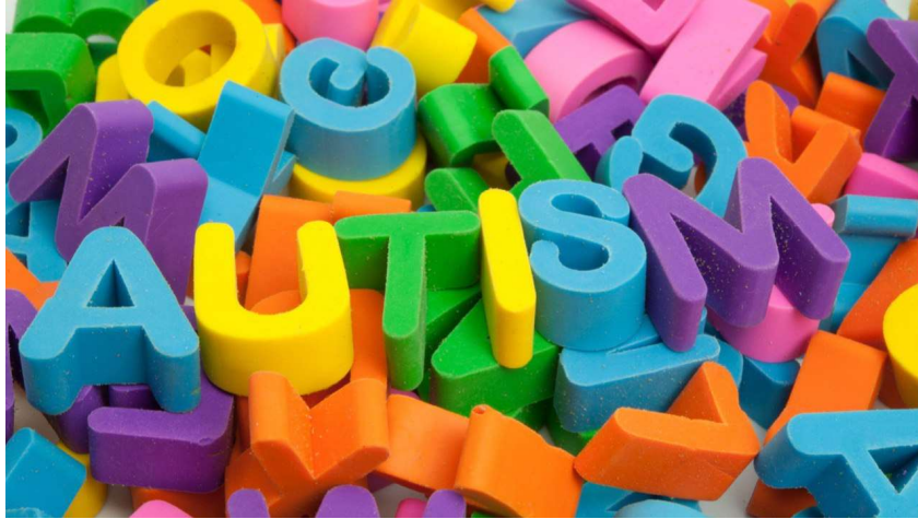
Slika 1 Raznobojna slova koja čine riječ "AUTISM"

Autizam je razvojna teškoća koja se javlja u ranoj dobi, a utječe na način komunikacije, odnose s drugim ljudima te na drugačiji način rada mozga i obradu informacija iz okoline.