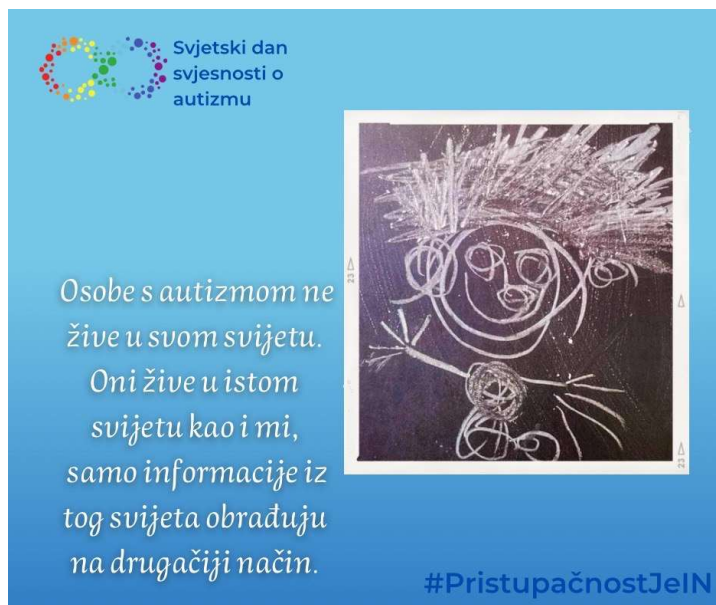
Slika 2 Crtež kredom koji je nacrtalo dijete s autizmom (koje inače ne crta olovkom) uz natpis: Osobe s autizmom ne žive u svom svijetu. One žive u istom svijetu kao i mi, samo informacije iz tog svijeta obrađuju na drugačiji način.

Zbog sve brojnijih znanstvenih spoznaja o autizmu, širi se i svijest o neurorazličitosti. U današnje vrijeme sve se češće možemo susresti s autizmom u književnosti, filmskoj umjetnosti i TV serijama. Za najmlađe postoje slikovnice koje im približavaju različitost i izazove s kojima se susreću njihovi vršnjaci s autizmom.