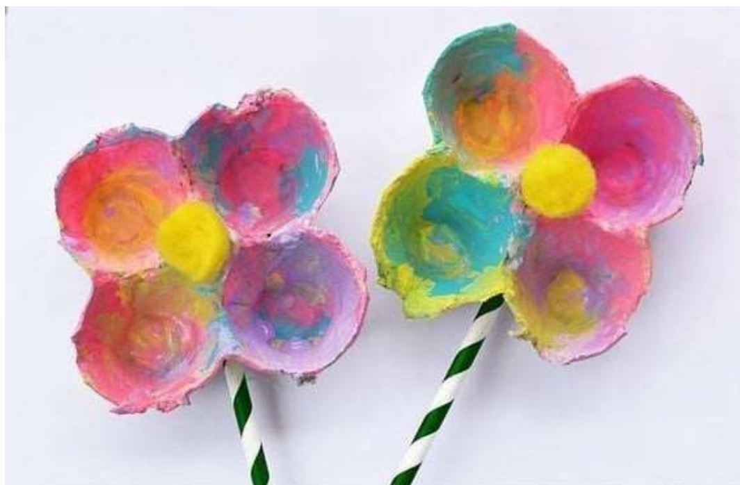
Pripremila: Sanja Pađen