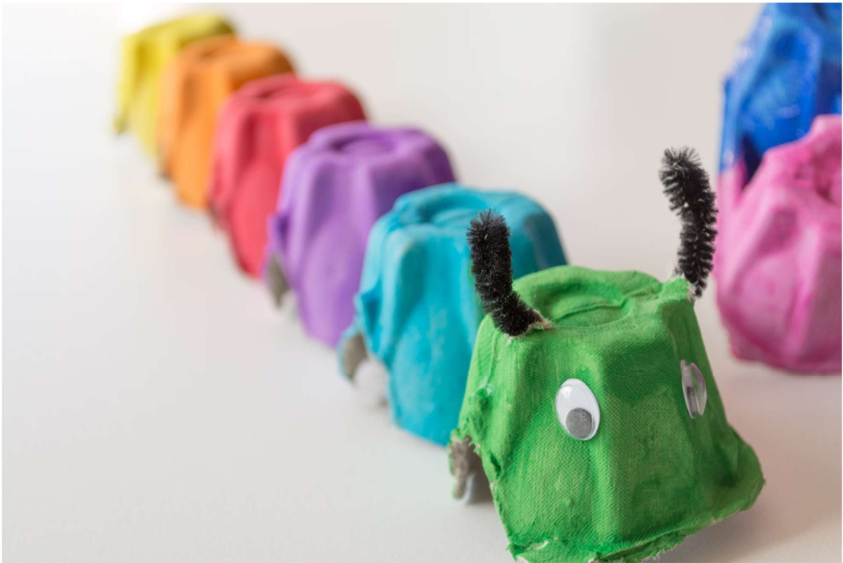
Egg Carton Caterpillar